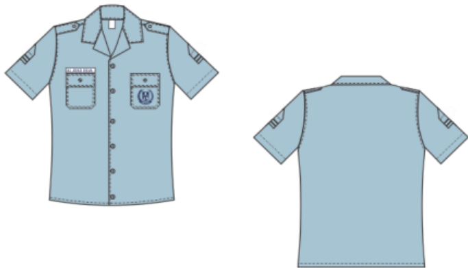
Figura - Camisa social meia manga masculina

*As dimensões apresentadas são aproximadas para tamanho M