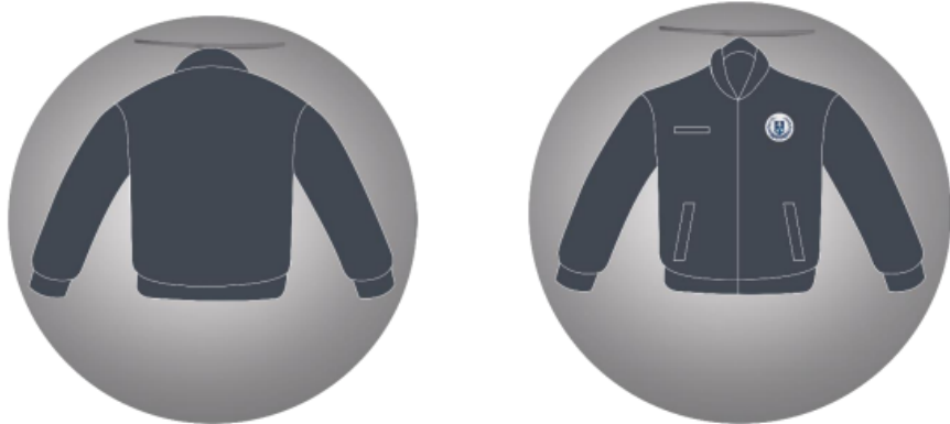
Figura : Jaqueta d

*As dimensões apresentadas são aproximadas para tamanho M