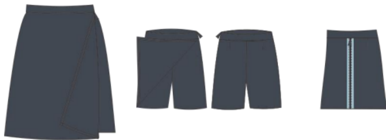
Figura – Saia Calça