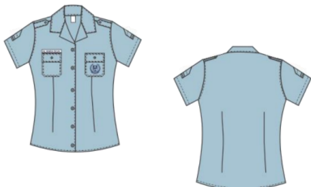
Figura - Camisa social meia manga feminina

*As dimensões apresentadas são aproximadas para tamanho M